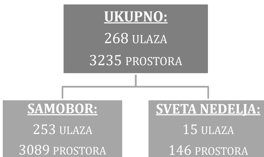
Grafikon 2. Prikaz broja ulaza te stambenih i poslovnih prostora u 2017. godini

S danom 31.12.2017. godine upravljali smo s 268 ulaza i s 3235 stambenih i poslovnih prostora što iznosi sveukupno oko 165 000 kvadratnih metara površine. Podaci o broju ulaza te stambenim i poslovnim prostorima za Grad Samobor, Breganu i Grad Svetu Nedelju navedeni su u sljedećem grafikonu: